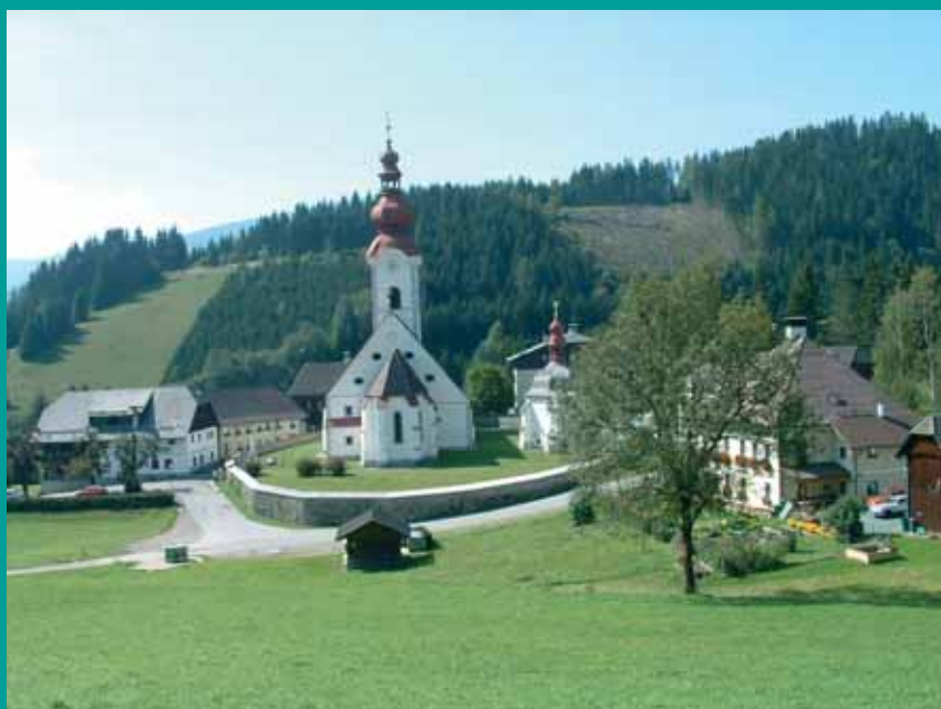
Blick auf Sirnitz

Das Partnerschaftskonzept kann im Rathaus angefordert werden, weitere Informationen sind auch auf der Internetseite der Gemeinde www.hude.de unter der Rubrik Partnerschaftsarbeit erhältlich.